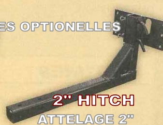
2" HITCH ATTELAGE 2"