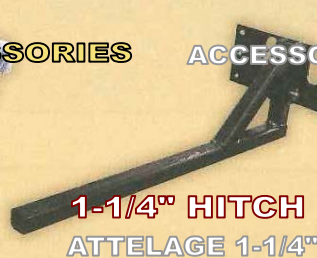
1-1/4" HITCH ATTELAGE 1-1/4"