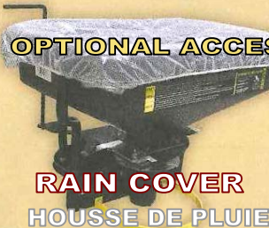
RAIN COVER HOUSSE DE PLUIE