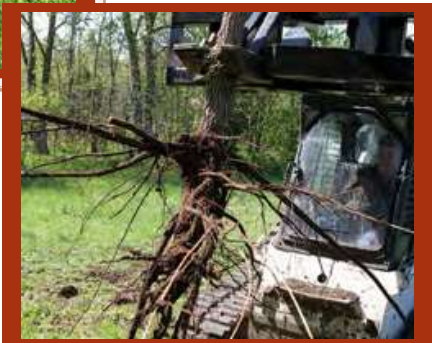
NO MORE STUMPS

Machoire puissante pour une forte adhérence et force de traction. Pointe dentelée pour creuser les racines ou ramollir le sol Construction robuste, permet de dégager les abords de route et fossés