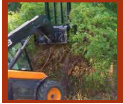
PULL MULTIPLE ROSES OR SHRUBS